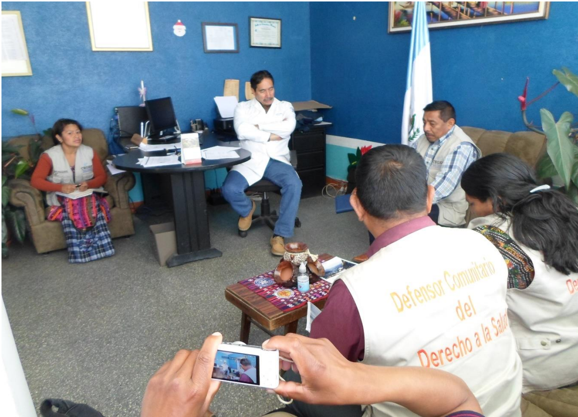
La REDC-Salud en reunión con el sub-director del Área de Salud.

Visita al Área de Pediatría: Los defensores visitaron dicha área con el fin de verificar las condiciones y entrevistar algunos pacientes internos. Se logra verificar lo siguiente: las madres de los niños y niñas internadas manifiestan que la atención es buena de parte del personal que atiende, pero el problema es que algunas de ellas han tenido que comprar medicamentos para el tratamiento de sus hijos implicando alto costos y que no cuentan con dichos recursos.