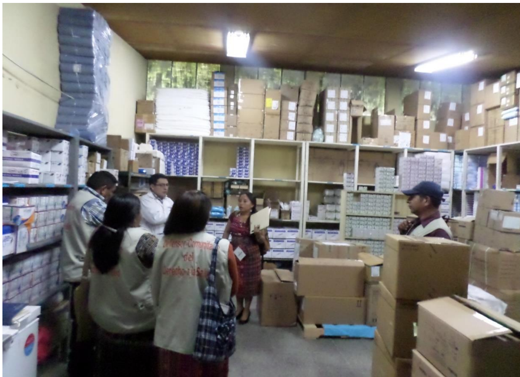
Bodega de medicamentos.