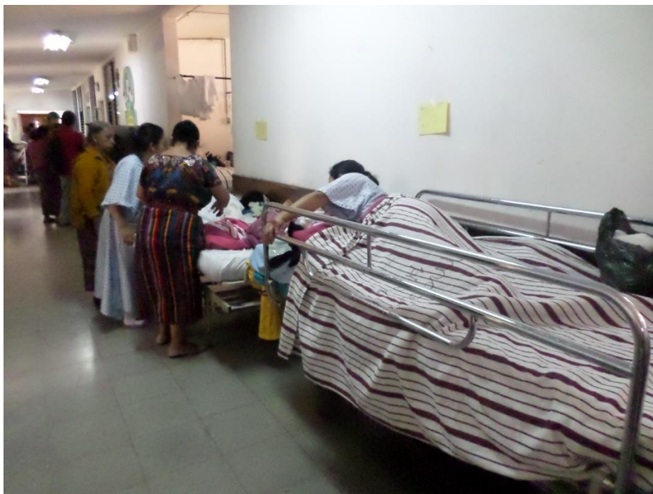
Pacientes ubicadas en corredor del área de maternidad.

mencionó que no les dan la medicina que es necesaria para su tratamiento y deben de comprar en farmacias privadas implicando gastos.