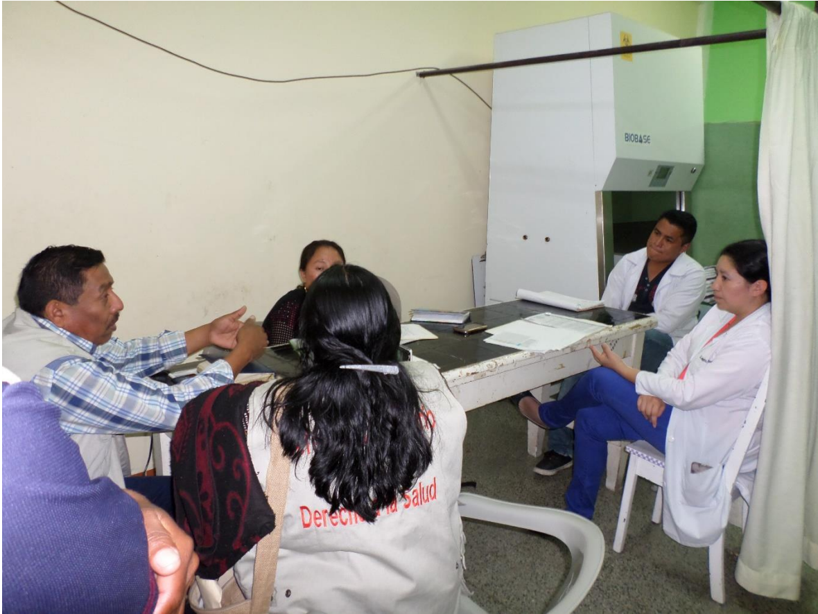
Reunión con el personal de laboratorio y la REDC-salud.

Visita a la bodega de medicamentos del Hospital; el encargado de la farmacia informa que se tiene abastecimiento de medicamentos para cubrir a los pacientes internados pero no así a la consulta interna que sólo les dan receta y deben de comprar sus medicamentos. Hace falta material médico quirúrgico eso debido a la falta de pago y se tienen deudas. Falta de personal para atender en la farmacia sólo trabajan tres en dicha área. El techo presupuestario sigue igual y la demanda cada vez en aumento.