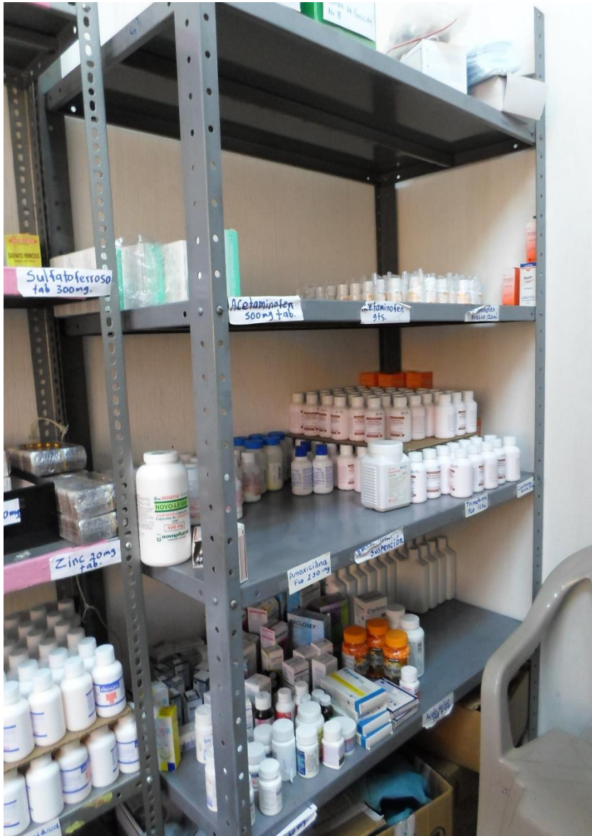
Bodega de medicamentos