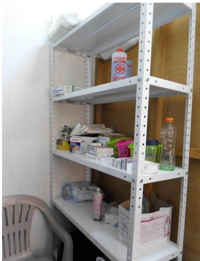
Bodega de medicamentos.

1 por falta de atención o insatisfacción durante hospitalización.