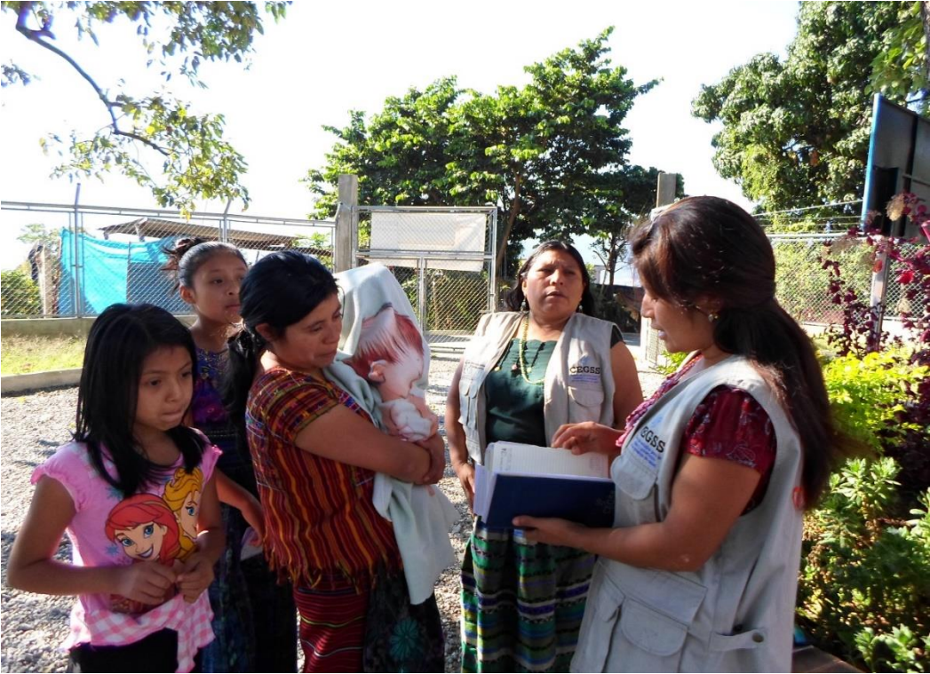
Entrevistas a usuarias del servicio de salud.