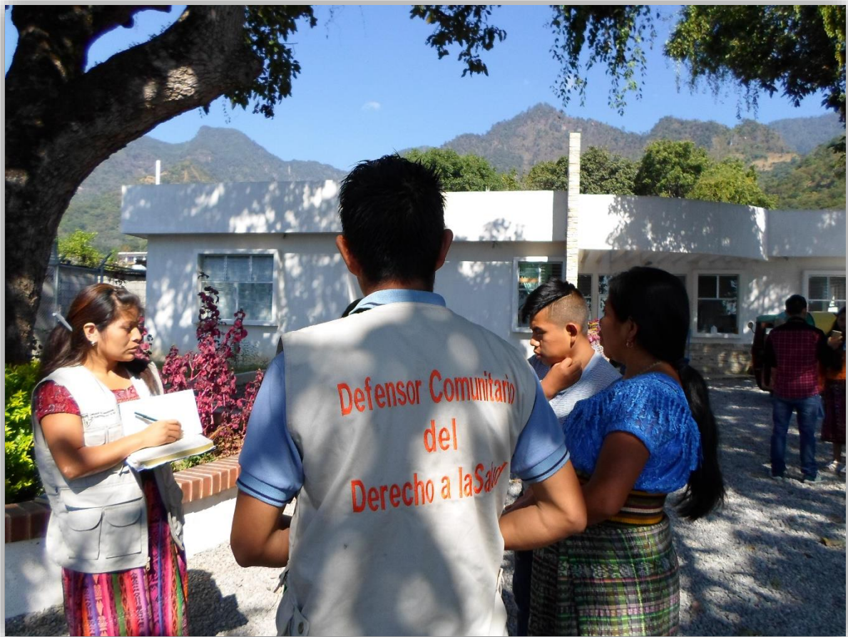
Diciembre 2016