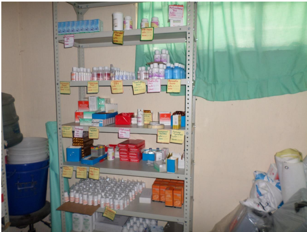
Bodega de medicamentos. Puesto de Salud Jaibailto.

La Red de Defensores por el Derecho a la Salud se reunió con la encargada del Puesto de Salud con el objetivo de identificar los problemas que se tiene en dicho servicio donde manifestó lo siguiente: no se cuenta con suficientes medicamentos para el tratamiento de las enfermedades que aquejan a la población.